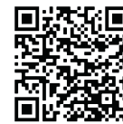
Case Study ZF