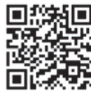
Case Study EPLAN