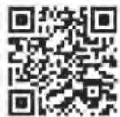
Case Study EPLAN